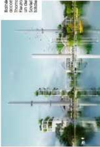
Bainéoli : un nouveau promoteur pour accompagner la nouvelle via des friches Thomson de Bagnac-sur-Loup. Fusion de l'initiative, véritable partenariat un client-acteur. (atelier Thomson, née Soybel) en 1982, a fermé en 2005 et finalement abandonnée depuis 2007.