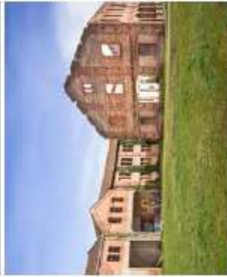
La Manufacture, Villeneuve-sur-Yonne (91) XTU Architects Anouk Legendre et Nicolas Desmazières

L'identification et la requalification des sites de friches, qu'elles soient industrielles, hospitalières ou commerciales représentent une réelle opportunité pour les collectivités de renouvellement urbain et/ou de renaturation.