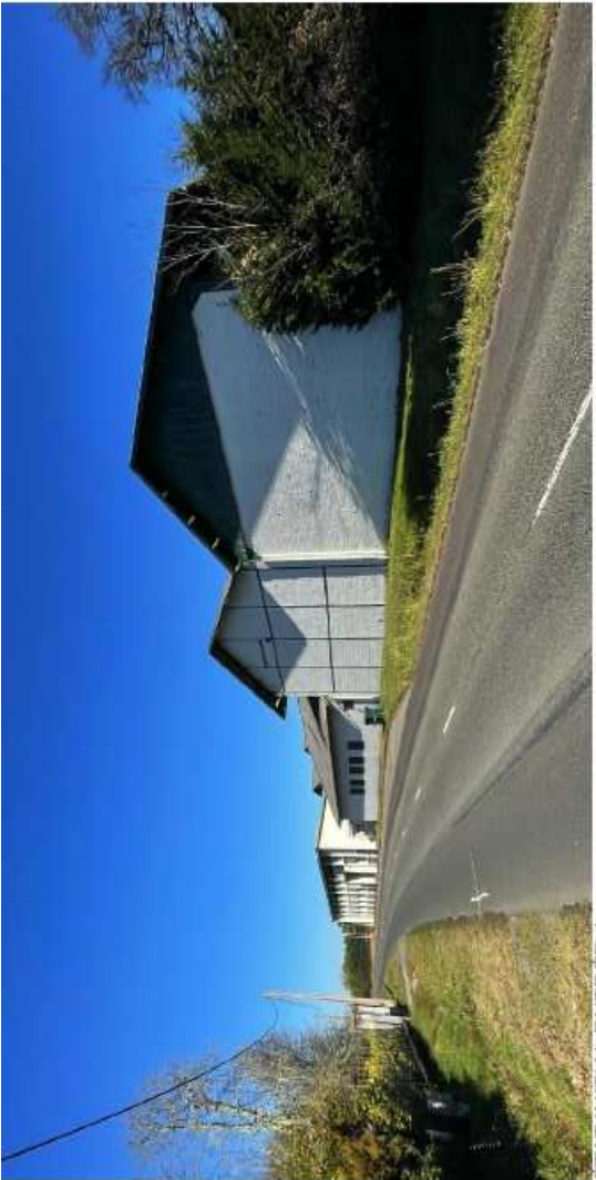
ETAT INITIAL ENTREE 1