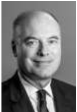
Renaud Dutreil Head of Private Equity

Ministre des PME de 2002 à 2007 Président de LVMH North America