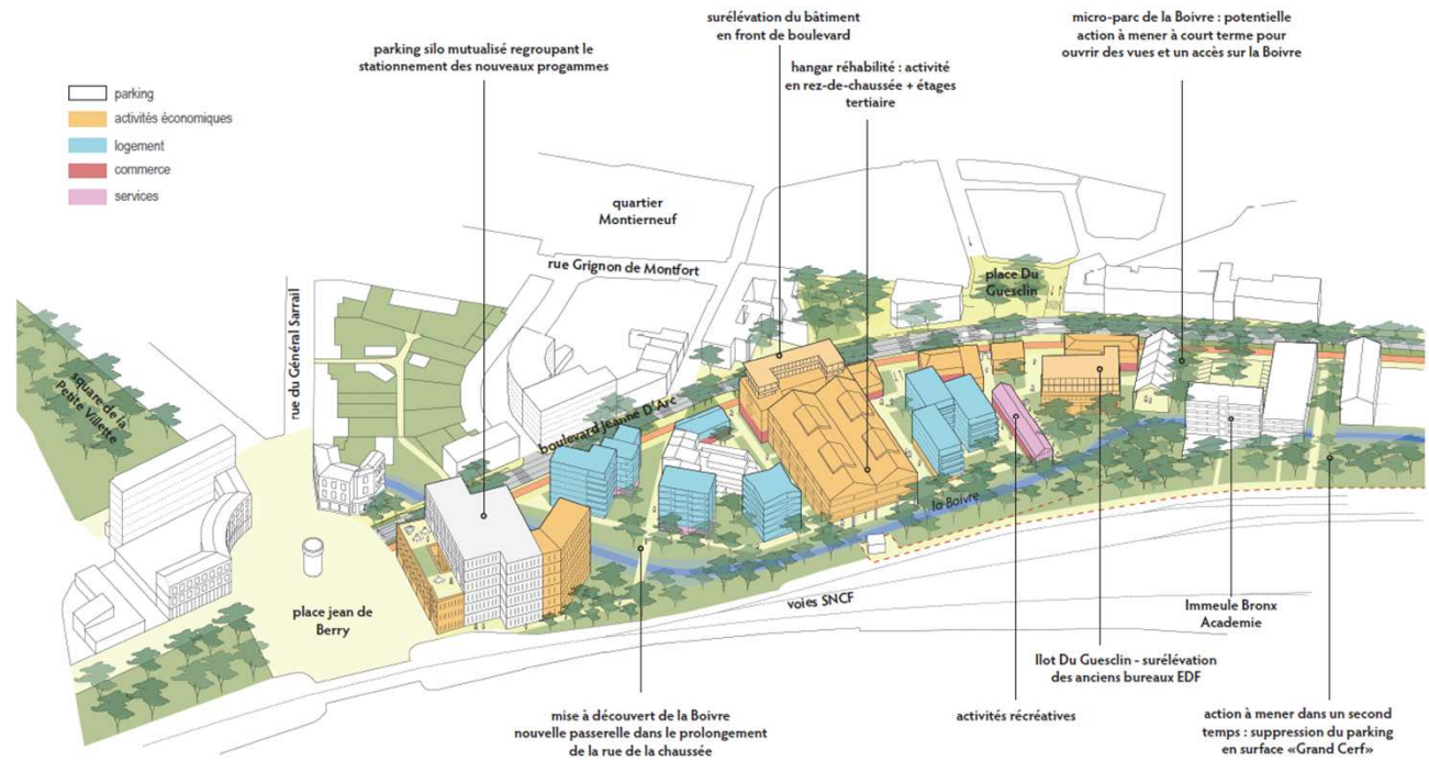
Axonométrie de la programmation - état projeté