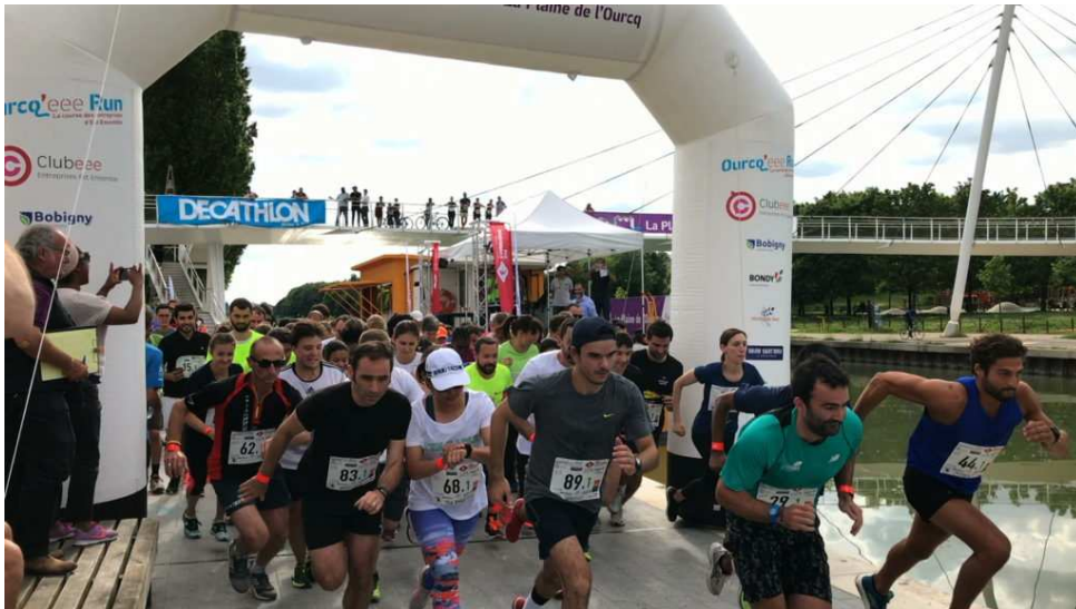
Départ arrivée course annuelle Ourcq EE Run