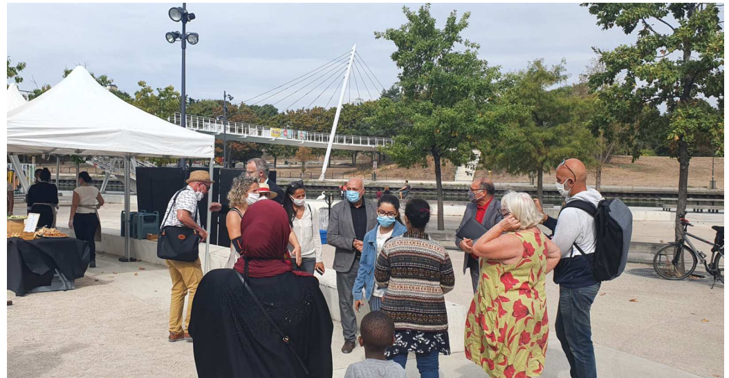
Réunions publiques de quartier