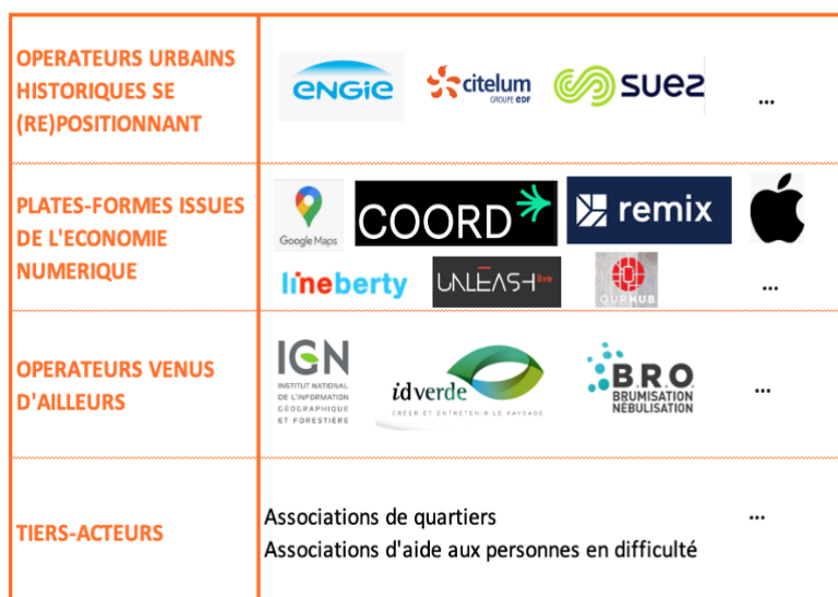
Figure 8 : Quelques exemples d'opérateurs de la fabrique des espaces publics

Toutes ces évolutions convergent vers une même hypothèse : les opérateurs parties prenantes de la fabrique des espaces publics se multiplient et se diversifient de plus en plus. On peut ainsi lister ceux que nous avons évoqués ci-dessus : les collectivités locales et leurs aménageurs, mais aussi les opérateurs immobiliers, les plates-formes numériques, les start-ups, les opérateurs historiques qui font évoluer leur offre de service, etc. Mais il faut également rajouter les associations, dont on a bien vu l'importance pendant le Covid (par exemple pour l'aide aux personnes sans abri ou très démunies). Il faut aussi rajouter les habitants, parce qu'on pressent bien que la nouvelle importance de l'« espace ouvert en bas de chez soi » fait que certains habitants-riverains demanderont à être davantage impliqués dans sa fabrication et sa gestion, et que le « quartier en bas de chez soi » devient une nouvelle échelle urbaine à faire fonctionner.