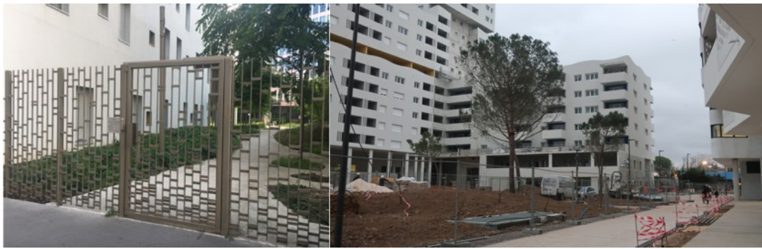
Figure 4 : Rue Marcel Bontemps à Boulogne-Billancourt, Rue intérieure de Smartseille en février 2019

Ces structures soulèvent plusieurs questions quant à leur mise en œuvre et leur évolution dans le temps 6 , et posent notamment la question de l'accessibilité des « espaces ouverts » (qui ne sont plus des « espaces publics ») qu'elles contiennent. Leur ouverture éventuelle à d'autres habitants ou usagers du quartier hors périmètre de l'ASL dépend du bon vouloir en effet de cette dernière. A une autre échelle, elles renvoient aux problématiques des « gated communities » 7 .