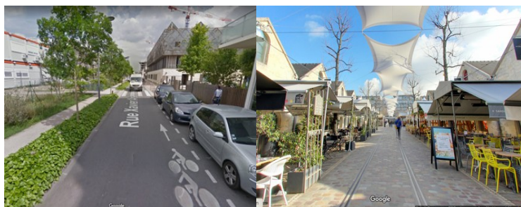
Figure 2 : Rue Xavier Arsène-Henry à Bordeaux et Cour Saint-Emilion à Paris

Le Cour Saint-Emilion, à Paris , relève d'une situation différente. Il s'agit de fait d'un centre commercial à ciel ouvert (23.000 mètres carrés GLA), et l'ensemble du site a été réalisé par Altarea Cogedim (en 1997, avec les architectes Valode et Pistre), qui continue à le détenir et à le gérer. En théorie, le site est accessible 7 jours sur 7, 24 heures sur 24, à tout le monde. On peut ainsi parler d'une accessibilité à tous, sous réserve des décisions du propriétaire. On est alors très proche du modèle anglo-saxon des « privately owned publics spaces » 2 .