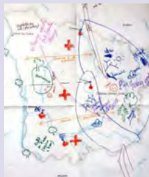
Spatialisation des impacts du changement climatique à la suite de la réalisation d'une chaîne d'impacts, Nièvre (accompagnement Cerema).

Souvent, de nombreux diagnostics sectoriels existent déjà, et la connaissance des acteurs de terrain et de la population apporte des éléments à articuler et relier sur lesquels s'appuyer.