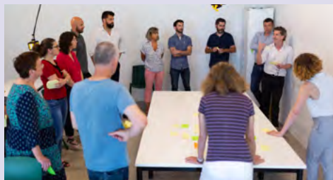
Initiation d'une démarche de résilience autour de la révision du SCOT Pays-Basque et Seignanx (Accompagnement Cerema).

Entamer une démarche de résilience peut se faire à toute échelle de temps et d'espace, pour tout projet : un document de planification, une opération d'aménagement, une reconstruction post-crise, la définition d'un projet de territoire... offrent autant d'opportunités pour bifurquer.