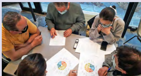
Identifier des solutions transversales pour renforcer un plan d'action – Plan Communal de Sauvegarde, Communauté d'Agglomération des Portes de l'Isère (38) (Accompagnement Cerema).

S'enrichir des expériences sur d'autres territoires facilite le passage à l'action et permet de ne pas se sentir seuls face à ces défis. Depuis 2020, la boussole de la résilience peut être mobilisée à différentes étapes d'une démarche de résilience et a déjà été éprouvée par de nombreux acteurs et territoires.