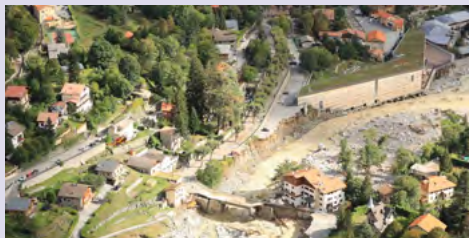
Introduire une approche résiliente dans des projets existants malgré l'urgence, Vallée de la Roya (06) (accompagnement Cerema).

Concrétiser la résilience passe par un changement de posture des acteurs, qui questionnent les projets, financements, aménagements en cohérence avec les différents enjeux : sobriété, besoins essentiels, changement climatique... Amorcer la résilience du territoire commence souvent par un courage politique : celui d'arrêter ou de réorienter les projets qui augmentent la vulnérabilité du territoire ou qui le fragilisent. L'enjeu est de créer de nouvelles synergies et coopérations et de s'autoriser à imaginer faire autrement. C'est la démarche initiée par la vallée de la Roya (06), qui a mené à l'établissement de sept critères de résilience conditionnant les projets de reconstruction nécessaire dans l'urgence et à venir.